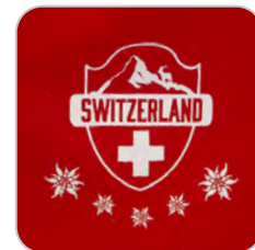
AA4989 ELON CASUAL MASKE 240 x 145 mm