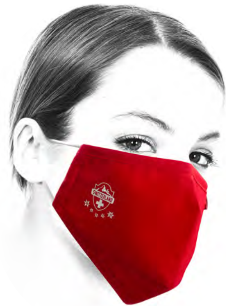
AA4948-03 SWISS CASUAL MASKE 240 x 145 mm

Zeigen Sie mit dieser Gesichtsbedeckung Flagge für die Schweiz! Diese bequeme Abdeckung von Nase, Mund sowie Kinn ist für einen besseren Sitz in der Gesichtspartie vorgeformt. Die Maske ist aus 100% Baumwolle und dreilagig verarbeitet. Die Aussenseite besteht aus dicht gewebtem Stoff mit einem geschmackvollen Swissness-Dekor. Um die Atmung zu erleichtern ist die weisse Innenseite weich und etwas gröber gewebt. Die beidseitige Ohrenbefestigung ist grössenverstellbar und das flexible Gummi ist stoffummantelt. Sie ist ebenfalls grössenverstellbar. Die Maske ist waschbar in der Waschmaschine, daher mehrfach benutzbar.